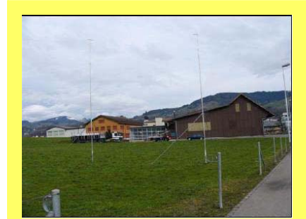
Bauplatz mit Visieren

Unten ist der Grundrissplan der Halle abgebildet, in welcher im vorderen Teil eine LWK Garage von Beda Steiner genutzt wird, und im grossen Teil Sport, hauptsächlich Inlinehockey, betrieben werden soll.